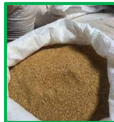
Суша барда (DDSG)